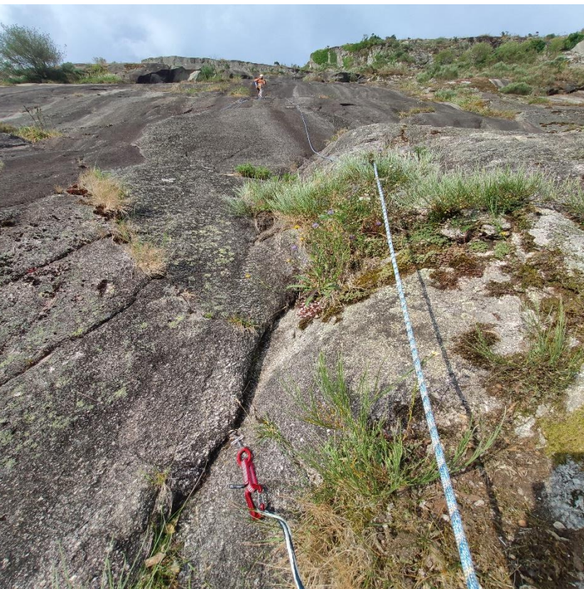
Posibilidad del segundo friend.