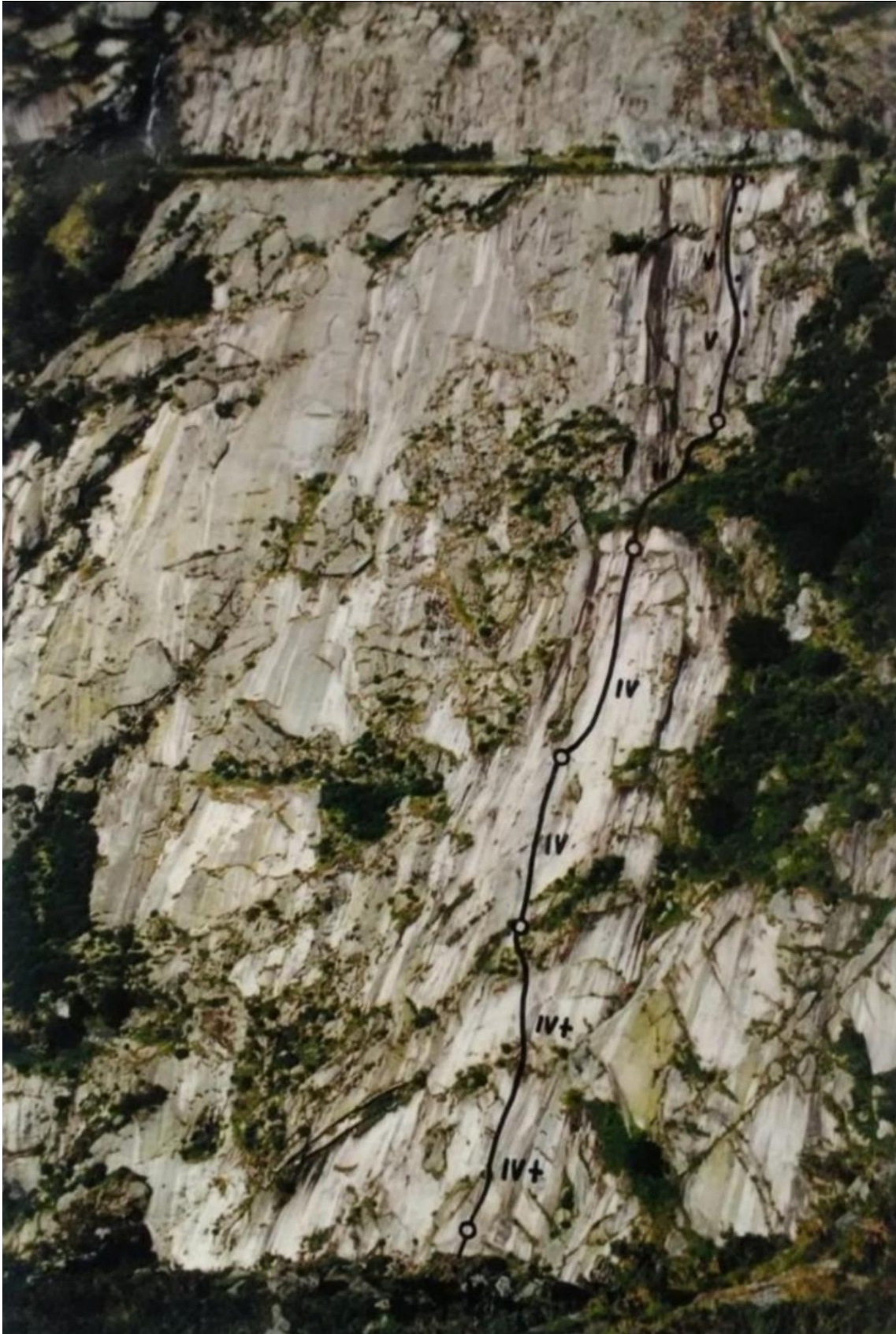
Croquis antiguo del aperturista de la via .1996