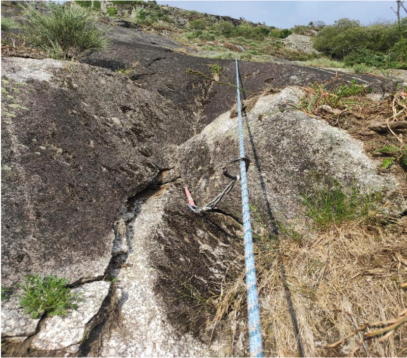
Posibilidad del primer friend